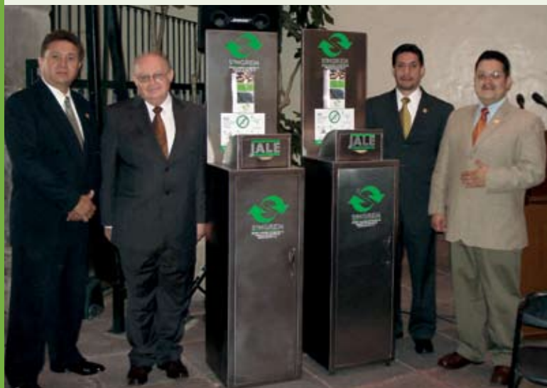
Evento de puesta en marcha del programa.

La implementación del programa se logró mediante la iniciativa del SINGREM y el apoyo de instancias como la SSa del estado de Querétaro, la Cofepris, la Delegación Federal de la Semarnat en Querétaro y Farmacias del Ahorro