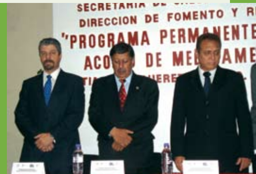
Asistentes al evento y depósito simbólico de medicamentos .